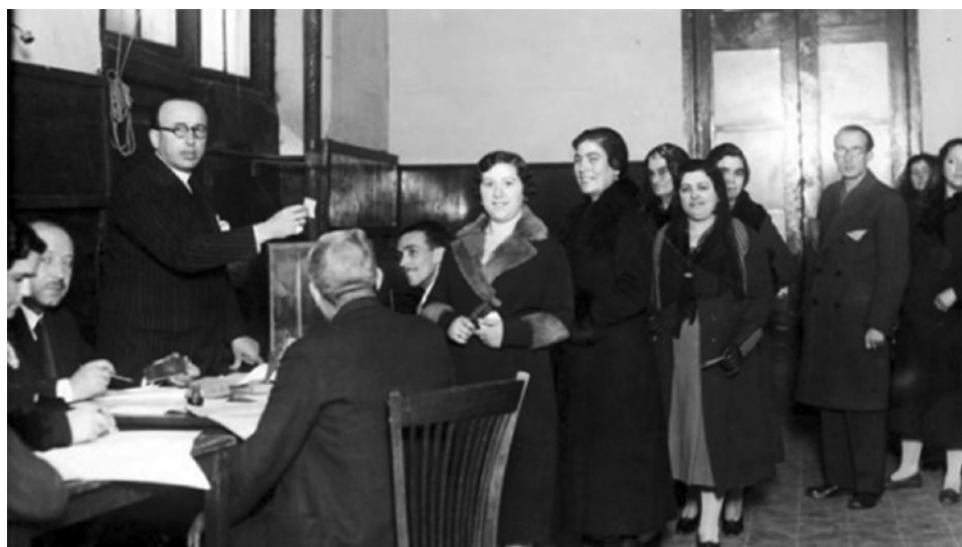
Mujeres españolas ejerciendo por primera vez su derecho al voto, elecciones de 19 de noviembre de 1933.