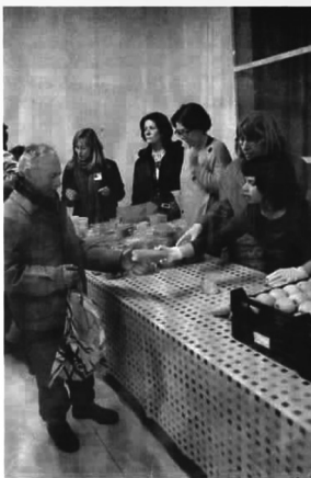
Comedor social para gente necesitada en el Barrio de El Raval, en Barcelona.

Basta con cuatro de esas condiciones para sufrir "privación material severa". Un ejemplo: si usted no puede hacer frente a gastos inesperados, no tiene televisión en color, no se ha podido ir de vacaciones, y no se ha podido comprar un coche, sufriría carencia material "severa". Dada la amplitud de los indicadores, se me escapa también por qué se denomina carencia "severa" a lo que puede ser fácilmente carencia poco severa, pensados. En todo caso este indicador al mide "no tener lo necesario para vivir".