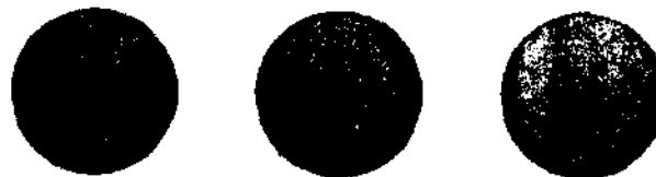
Fig. 5: Signo internacional especial para las obras e instalaciones que contienen fuerzas peligrosas

4. De noche o cuando la visibilidad sea escasa, el signo podrá estar alumbrado o iluminado. Puede estar hecho también con materiales que permitan su reconocimiento gracias a medios técnicos de detección.