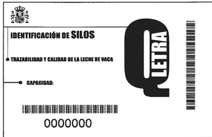
3. Etiqueta para la identificación de tanques de frío. Simbología de los códigos de barras: «Bar Code 39».