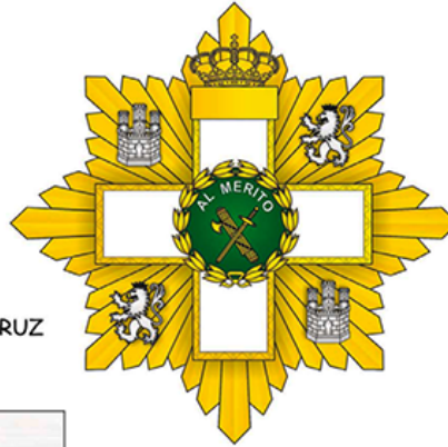
PLACA DE LA GRAN CRUZ