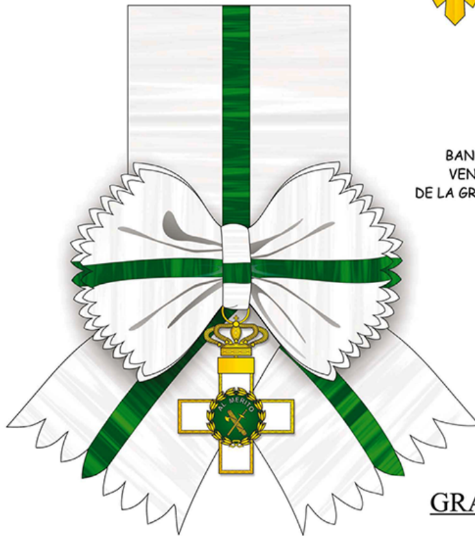
BANDA Y VENERA DE LA GRAN CRUZ