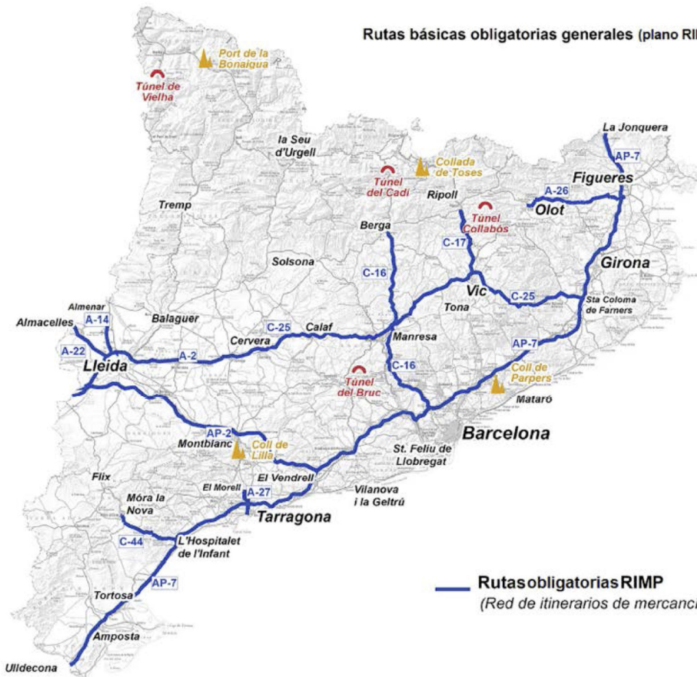
Rutas básicas obligatorias generales (plano RIMP de Cataluña)

Rutas obligatorias RIMP (Red de itinerarios de mercancías peligrosas)