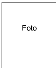
Fotografía del titular