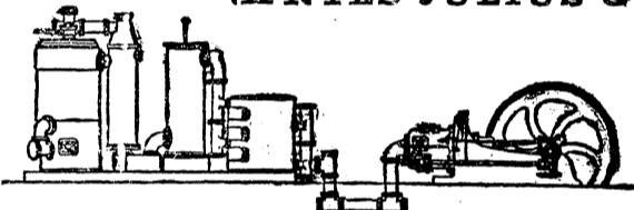
Bombas.—Calentación.—Material para ferrocarriles y minas.

Sociedad anónima.—Domicilio: Madrid—Mahón.—Talleres: en Mahón. Central: Madrid, Salón del Prado, 14. Sucursal: Barcelona, Plaza Palacio, 11.—Motores de gas, petróleo, gasolina, etc., Crossley.—Gasógenos sistema Crossley y Downson.—Instalaciones completas eléctricas.